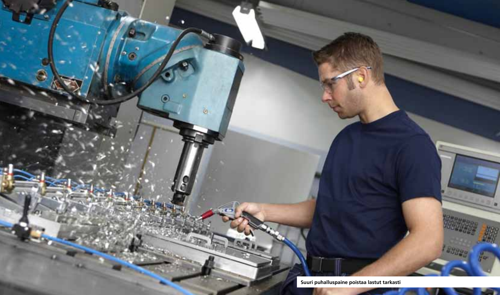
Suuri puhalluspaine poistaa lastut tarkasti