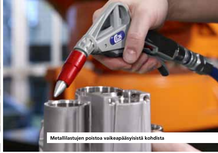
Metallilastujen poistoa vaikeapääsyisistä kohdista