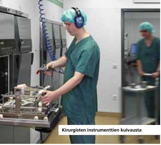
Kirurgisten instrumenttien kuivausta