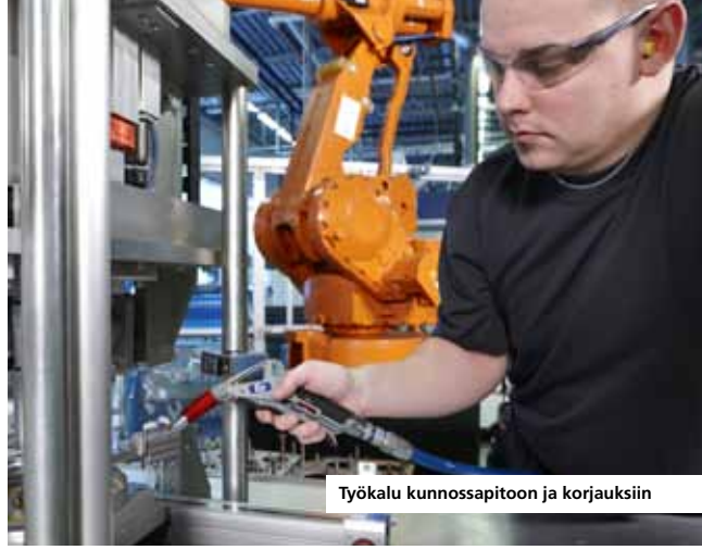
Työkalu kunnossapitoon ja korjauksiin