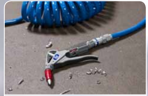
Myös vaativiin kohteisiin