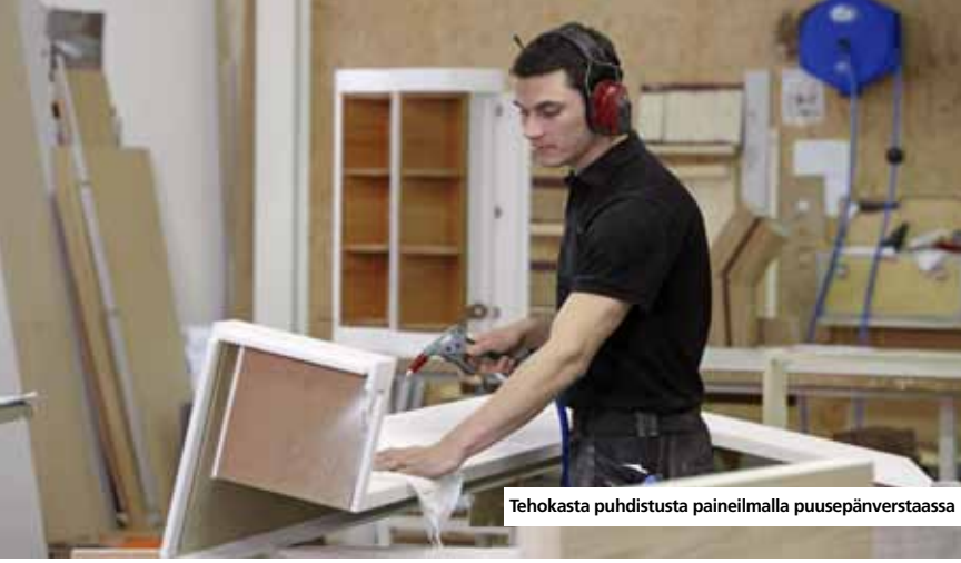
Tehokasta puhdistusta paineilmalla puusepänerveästä