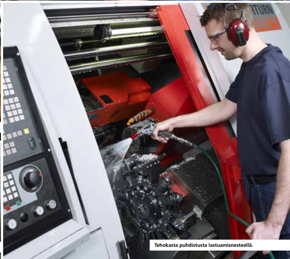
Tehokasta puhdistusta lastuamiskeinillä.