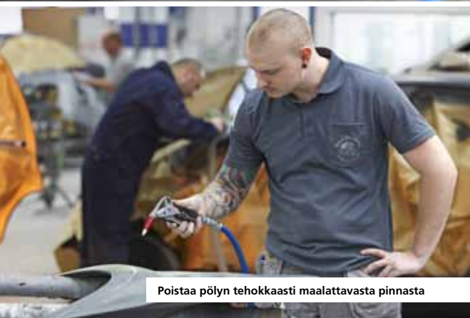
Poistaa pölyn tehokkaasti maalattavasta pinnasta