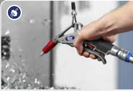
Paineilma- ja nestesuihku