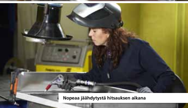
Nopeaa jäähdystä hitsauksen aikana